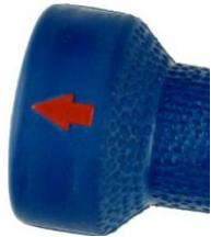
Flèche rouge de direction du jet

Spécification des pistolets en laiton ou laiton chromé (bleu uniquement)