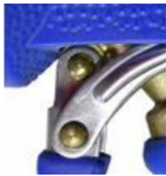
Poussoir inox renforcé